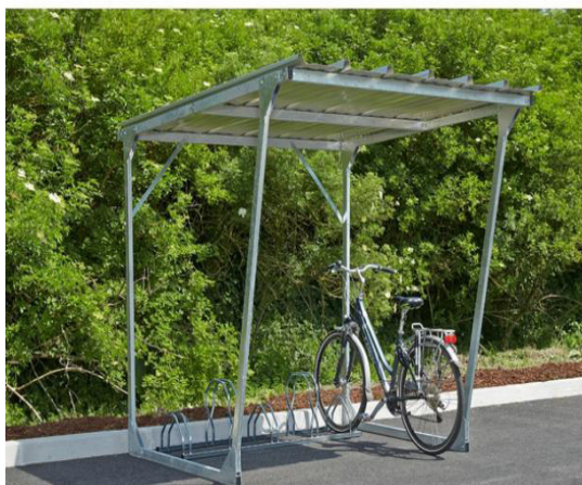
Abri Cycles CAP NORD