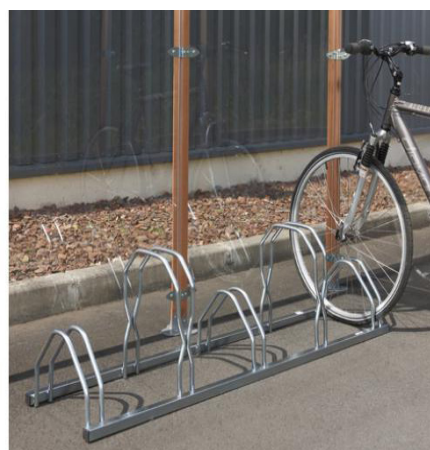
Support Cycles 5 places