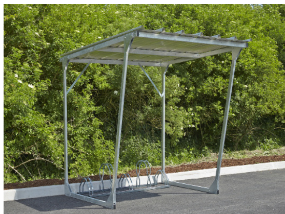
Abri Cycles CAP NORD - Initial