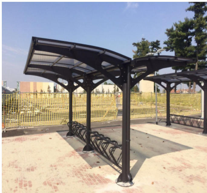
Abri Cycles LARUS Double Côtés - EXTENSION