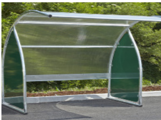
Abri Cycles LYS - Initial